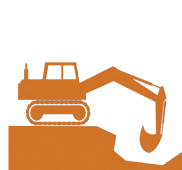
Movimiento de materiales